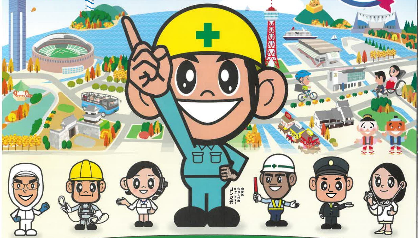
中災防 推進事務 ヨシダ君

参加申込 6/1より 受付開始 インターネットでのお申込みは 特設ウェブサイトから!